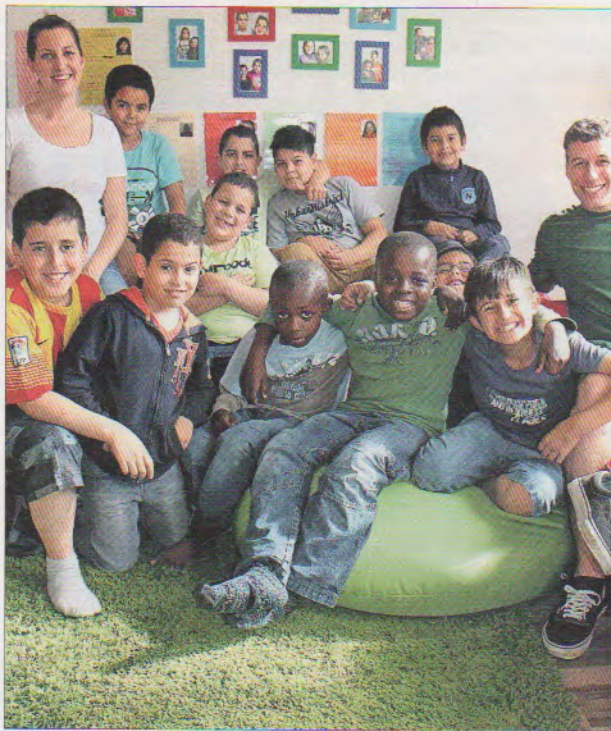
Die Kinder aus der Begegnungsstätte Mosaik freuen sich jede Woche auf Neue hier hin zu kommen.